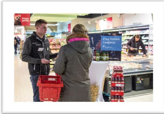
AgrarScout im Gespräch mit Verbraucherin