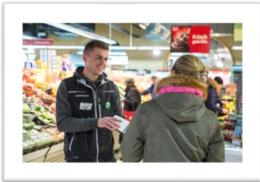
AgrarScouts im Dialog

Mehr Informationen zum AgrarScout-Netzwerk finden Sie hier: moderne-landwirtschaft.de/agrarscouts/