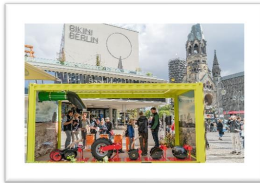
AgrarScouts auf der Foodweek Berlin